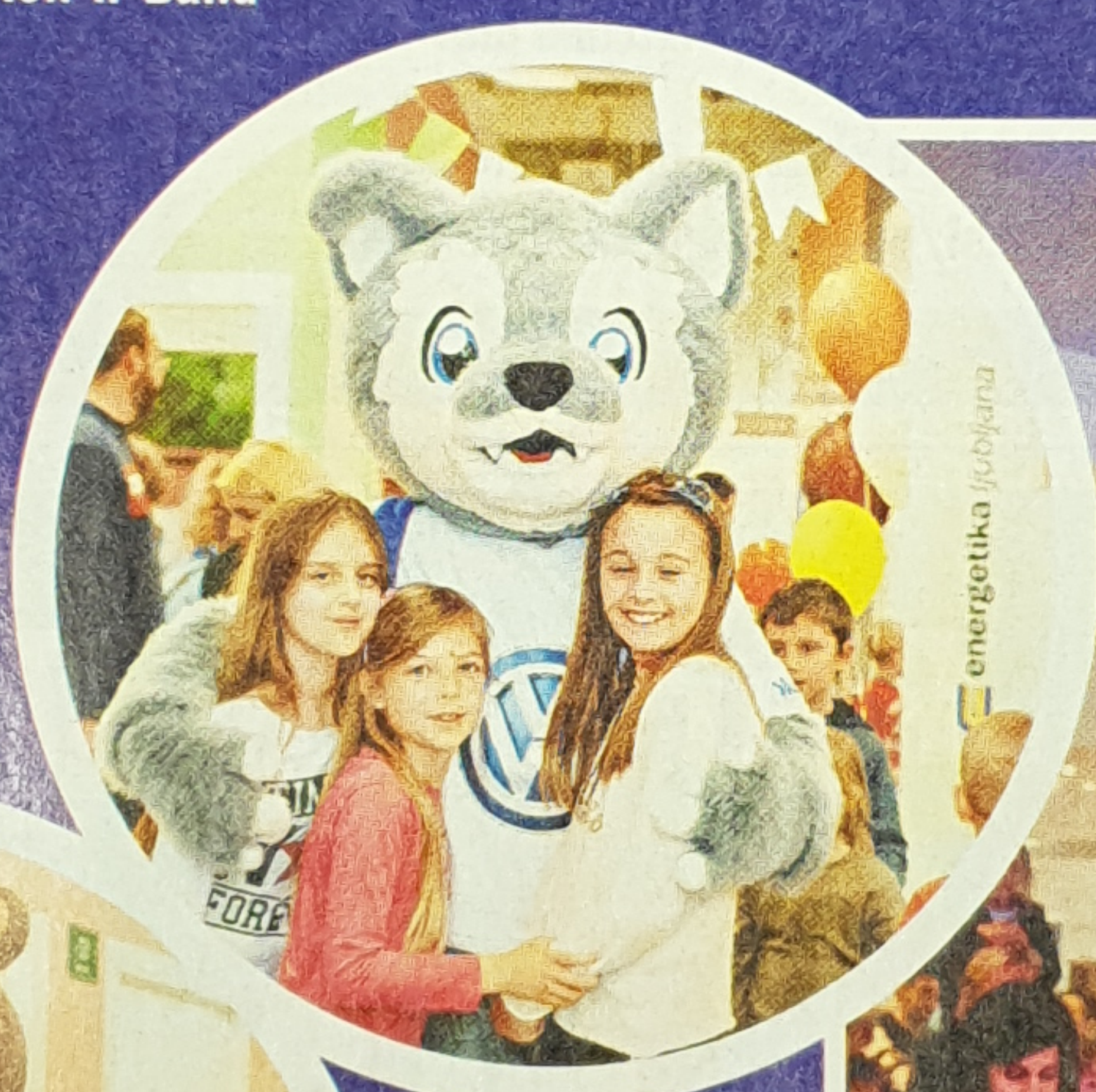
Volkswagnov Wolfi je navduševal manjše in malo manj manjše obiskovalce.