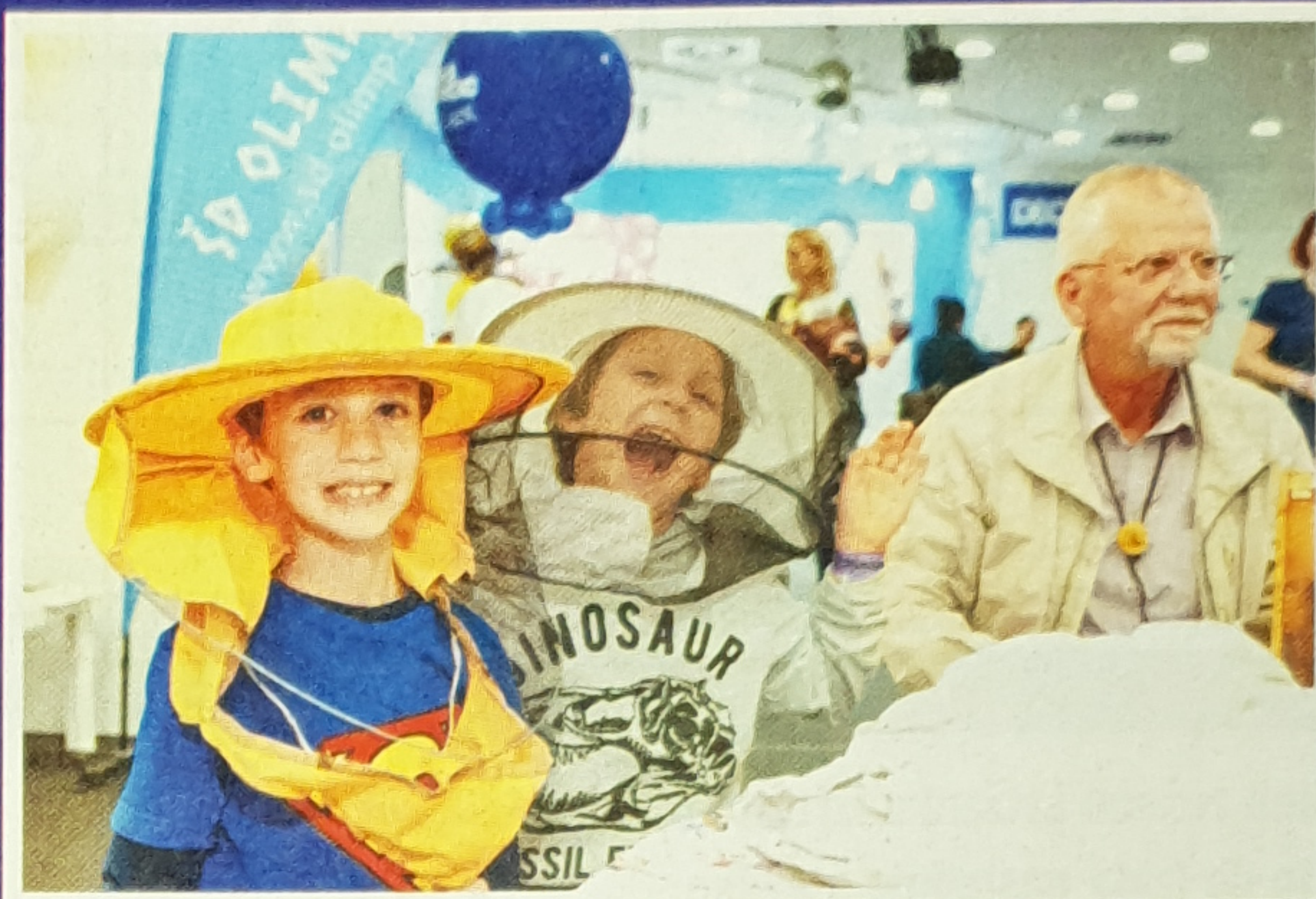
Otroci se zabavajo ob spoznavanju čebelarstva opreme.