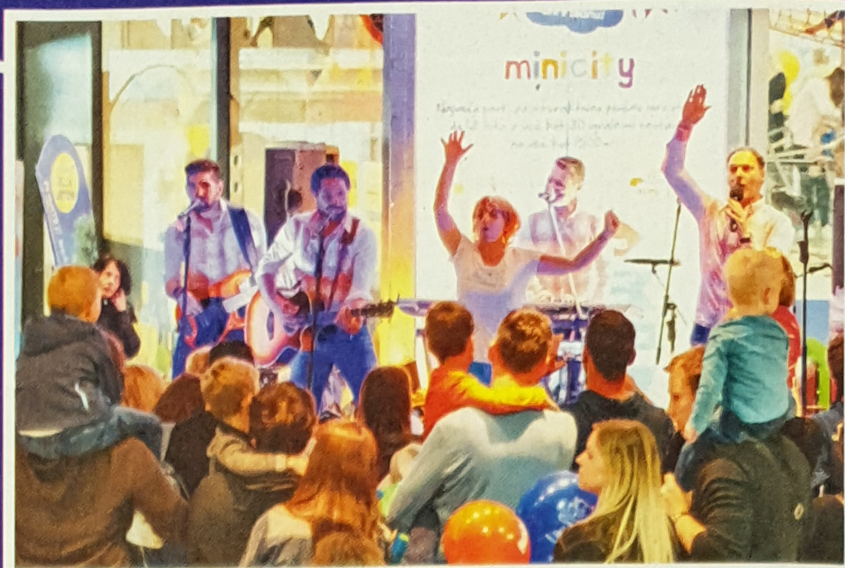
S Čuki je vedno zabavno.