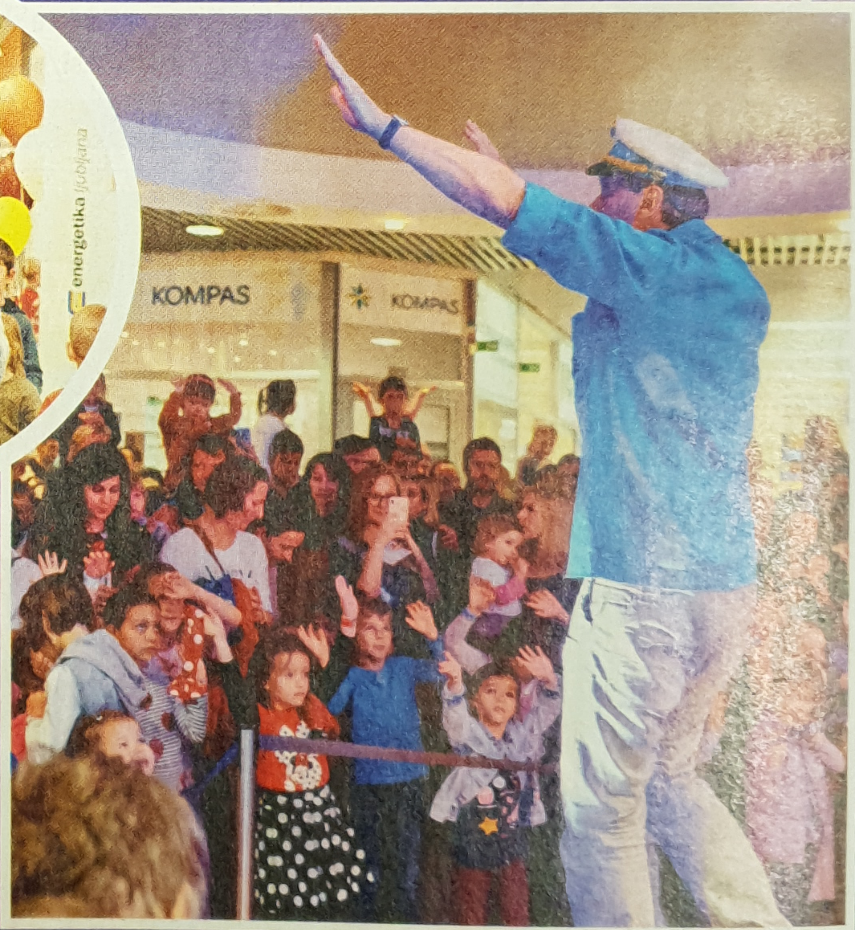
S Čuki je plesal tudi maček Reksi s Plesnim mestom.