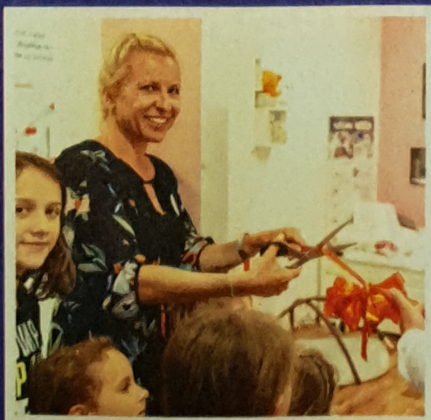
V porodnišnici so pozdravili nova partnerja, moemax Slovenija in Tadan.si.