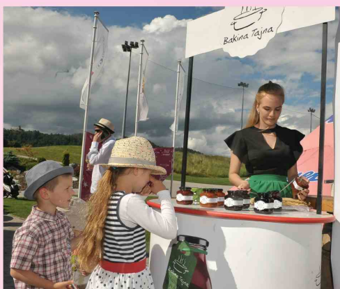
Tako otrokom kot odraslim se je prilegla marmelada Bakina Tajna, namazana na palačinke.