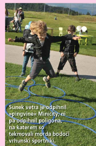
Sunek vetra je odpihnil »pingvine« Minicity, ni pa odpihnil poligona, na katerem so tekmovali morda bodoči vrhunski športniki.