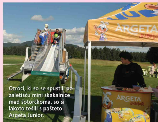
Otroci, ki so se spustili po zaletišču mini skalalnice med šotorčkoma, so si lakoto tešili s pašteto Argeta Junior.