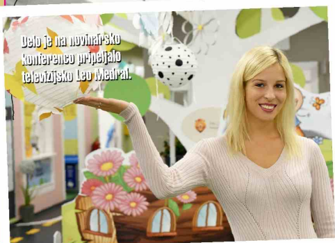
Delo je na novinarsko konferenco pripeljala televizijsko Leo Medral.